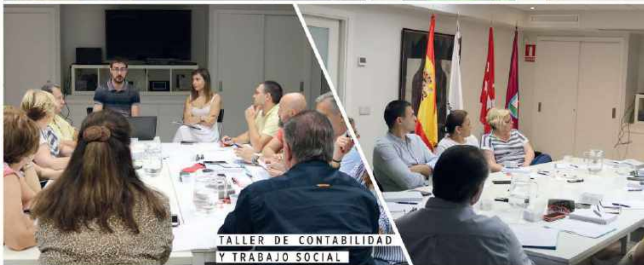
TALLER DE CONTABILIDAD Y TRABAJO SOCIAL