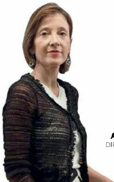
✍ POR SONIA RAMOS PIÑEIRO, DIRECTORA GENERAL DE APOYO A VÍCTIMAS DEL TERRORISMO

E ra la tarde del 17 de agosto de 2017, cuando todos los españoles nos quedamos conmocionados por el inesperado pero brutal atentado terrorista de las Ramblas. España no era objeto de la sinrazón terrorista desde los terribles atentados de 11 de marzo de 2004 aunque, desde esa fecha, ciudadanos españoles sí habían perdido la vida o habían resultado heridos en atentados terroristas fuera de nuestro país.