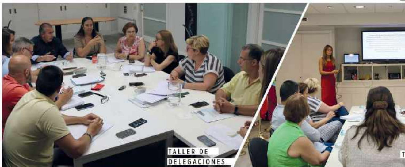
TALLER DE DELEGACIONES

Fueron dos jornadas intensas de trabajo pero muy necesarias, pues es necesario que todas las personas que representan a la AVT tengan la formación apropiada y estén más que capacitadas para llevar a cabo su labor.